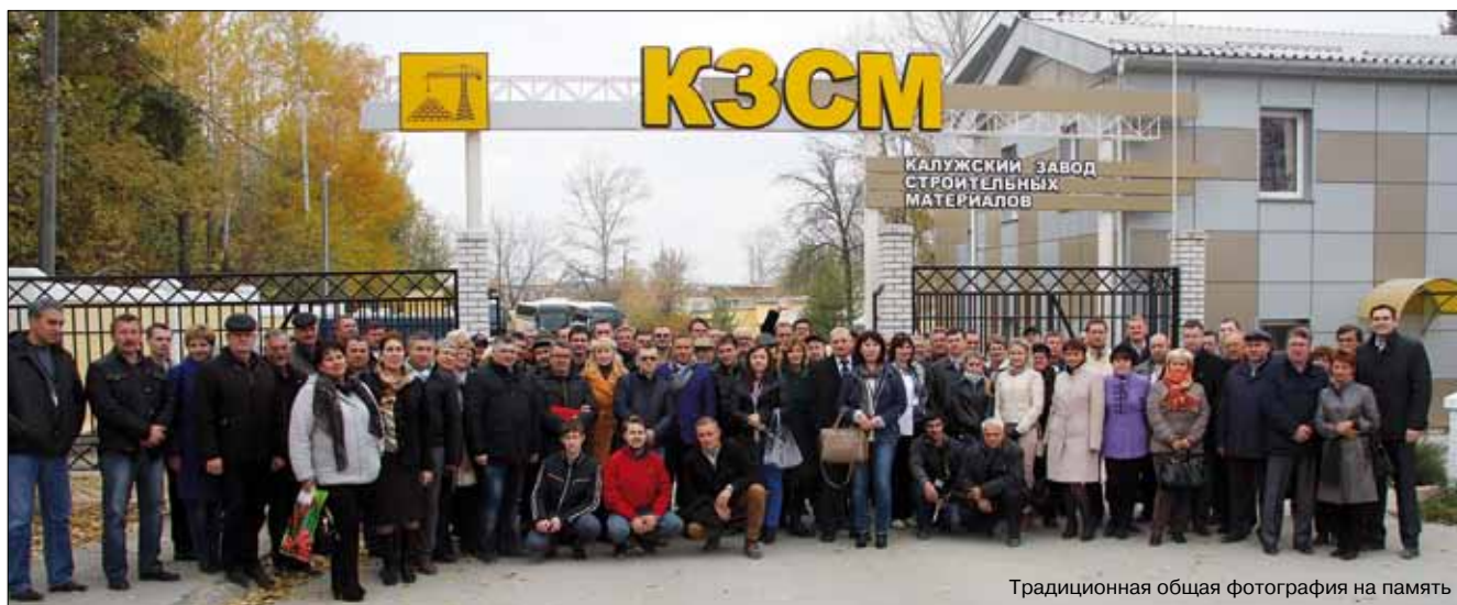
Традиционная общая фотография на память