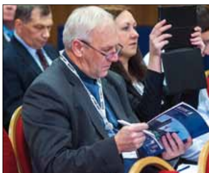
Полученная во время докладов информация вызвала серьезные размышления