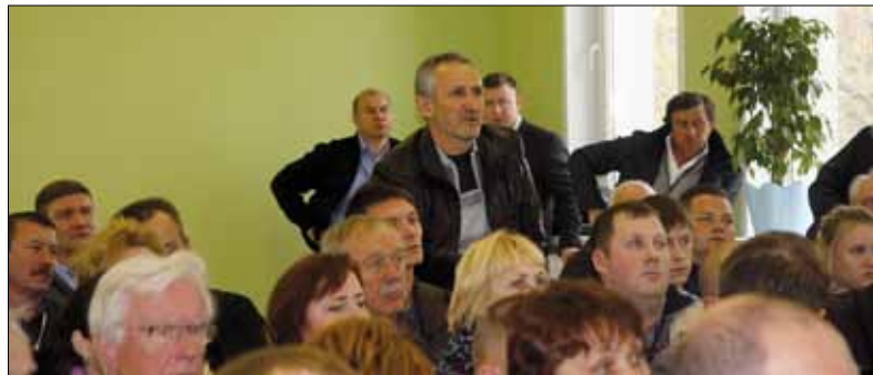
После посещения нового производства возникли дискуссии, которые помогли наиболее точно понять замысел проекта

транспортного оборудования и систем автоматизации силикатных заводов.