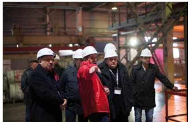
Про технологию производства автоклавного газобетона можно тоже рассказать очень эмоционально

Ежегодный форум силикатчиков СИЛИКАТЭкс, организуемый научно-техническим и производственным журналом «Строительные материалы»® с 2007 г., собрал этой осенью специалистов и руководителей предприятий по выпуску силикатных изделий, поставщиков сырья, представителей машиностроительных компаний и вузов из 32 регионов России, а также Белоруссии, Казахстана, Литвы, Германии, Китая. Генеральным спонсором конференции выступила единственная российская машиностроительная компания в области оборудования для силикатного кирпича ООО «Инвест-Технология» (Челябинск).