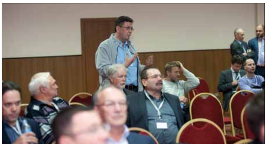
Активные участники дискуссий задавали вопросы, которые иногда ставили в тупик даже опытных ораторов