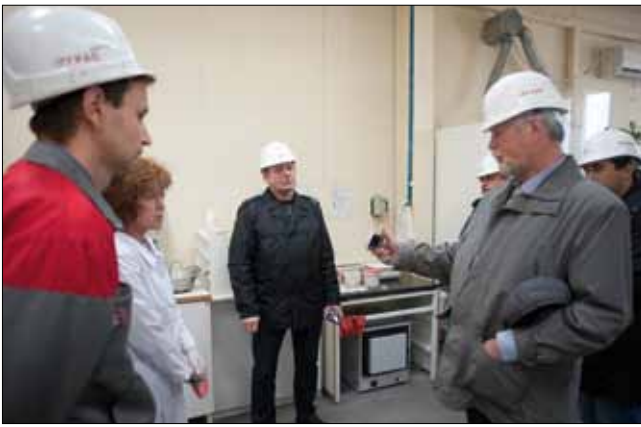
На заводе «ДСК Грас Калуга» гости пытались понять все тонкости производства. Полученные сведения каждый фиксировал как мог: кто-то запомнил, а кто-то записывал видео