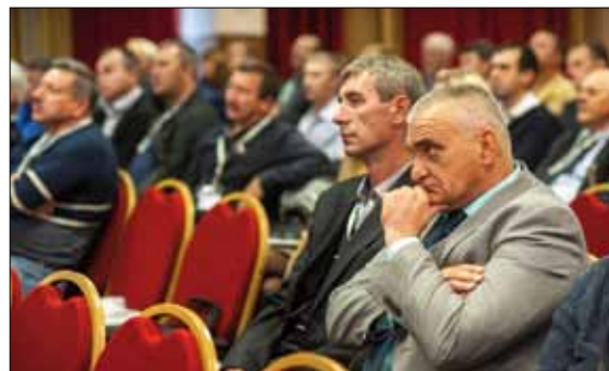
Представители компании «Укрспецизвесть» (Днепропетровск, Украина) участвуют в конференции не первый раз, но всегда находят для себя что-то интересное