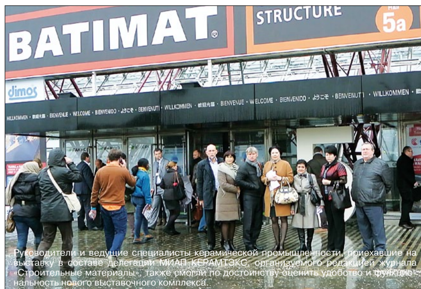
Руководители и ведущие специалисты керамической промышленности, приехавшие на выставку в составе делегации МИАЛ-КЕРАМТОКС, организуемого редакцией журнала «Строительные материалы», также смогли по достоинству оценить удобство и функциональность нового выставочного комплекса.