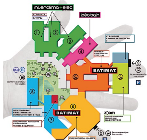
В выставочном комплексе «Пари Норд Вилльпент» выставка как на ладони!