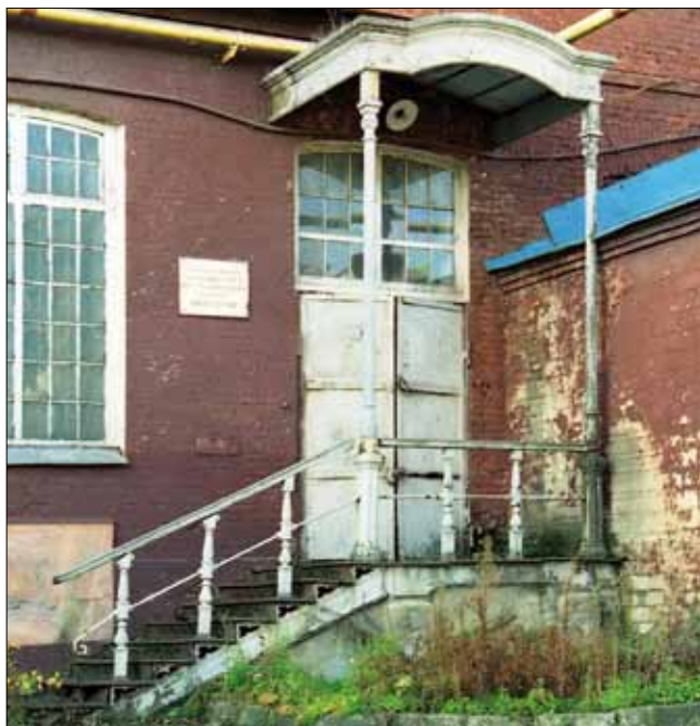
Рис. 3. Малая архитектурная форма, выполненная методом чугунного литья, конец XIX в. Пр-т Ленина, Большая Ивановская мануфактура

ло, несомненно, раскрытие бывшей производственной территории для общего пользования и обеспечение доступа к главному городскому природному объекту – реке Уводь.