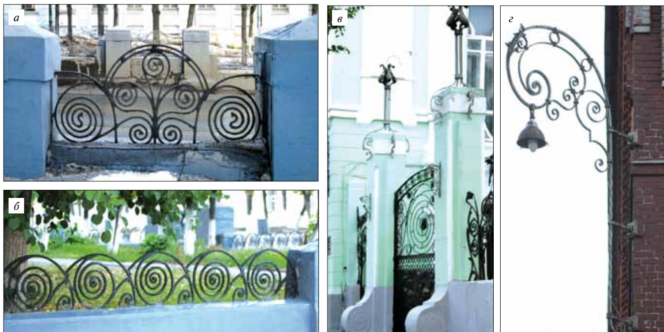
Рис. 4. Малые архитектурные формы, выполненные методом художественнойковки, начало XX в. (фото автора, 2013 г.): а – пр-т Ленина; б – ул. Батурина, бульвар; в – ул. Батурина, Музей ивановского ситца; г – пр-т Ленина, Большая Ивановская ману-фактура