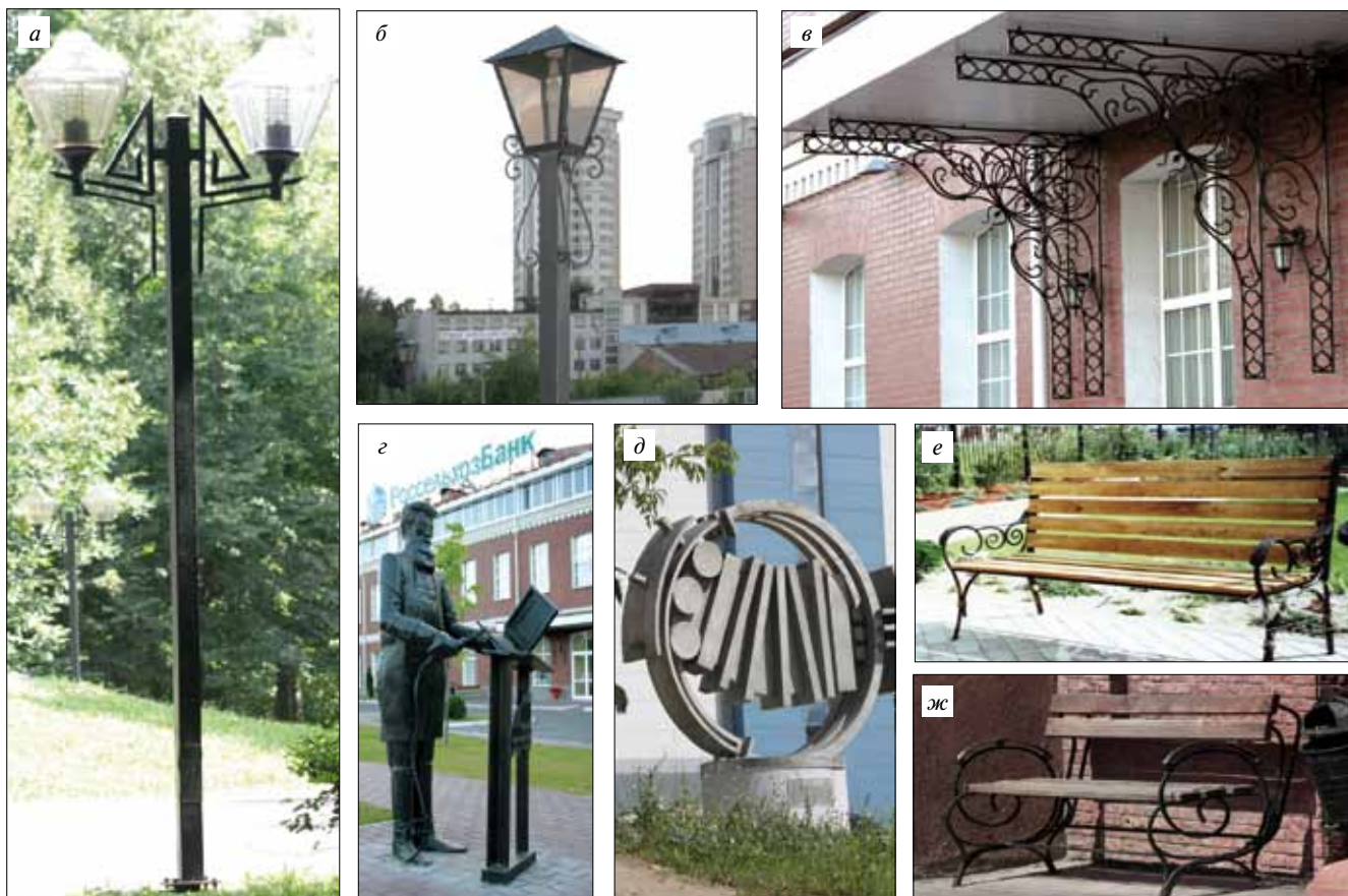
Рис. 6. Элементы благоустройства начала XXI в. (фото автора, 2013 г.): а – пр-т Ленина, сквер у Ивановского цирка; б, в – пр-т Ленина, Большая Ивановская мануфактура; г – пл. Пушкина; д – ул. Набережная; е – Шереметьев парк-отель; ж – Шереметьевский пр-т, здание банка

ми кронштейнами. В 1950–60-е гг. художественное оформление малых архитектурных форм выполнялось с применением декора, стилизованного под ампир, что в полной мере отражено в центральной части Иванова (рис. 5). Символика, использовавшаяся для оформления малых архитектурных форм центральной части Иванова, напрямую связана с историческими событиями, такими как образование Советского Союза, победа в Великой Отечественной войне, и имеет традиционные для этих событий художественные образы исторических личностей, пятиконечной красной звезды (рис. 5), серпа и молота, герба СССР, а также мотивы, свойственные сталинскому ампиру. В период советской власти изделия из бетона и железобетона получили большое распространение благодаря массовости их производства по типовым проектам, не отличавшимся разнообразием форм и видов.