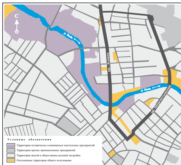
Рис. 1. Схема исторически сложившейся планировочной структуры Иваново

щественного назначения с целью раскрытия уникальной промышленной архитектуры для всеобщего обозрения. В Иваново за последнее десятилетие сменили свою функцию на общественно-деловую Отделочная фабрика им. Кирова (ныне офисно-деловой центр «Дербеневъ»), а также находящиеся в центральной части города на магистралях общегородского значения Шереметьевском проспекте и проспекте Ленина соответственно Ткацкая фабрика им. 8 Марта (ныне ТЦ «Серебряный город») и Большая Ивановская мануфактура (ныне ОАО «Россельхозбанк») (рис. 2). Преимуществом проведенной реконструкции ста-