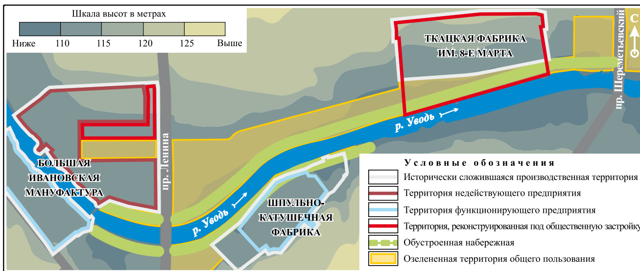
Рис. 2. Схема современного использования центральной части Иванова