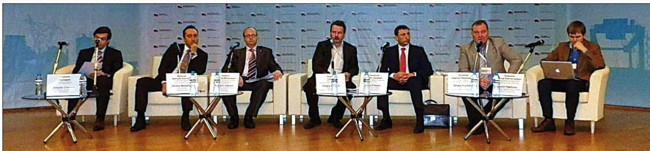
В рамках выставки была проведена конференция «Время развивать бизнес. Земли Фонда «РЖС» для производителей строительных материалов»

панией материалов следует отметить материалы марок Энергофлекс® и Алюбабл® (отражающая теплоизоляция). Энергофлекс® – это теплоизоляционный материал, имеющий закрытоячеистую структуру. Трубки Энергофлекс® используют не только как утеплитель для труб, но и при работе с арматурой и емкостями разного назначения. Рулоны Энергофлекс® предназначены для использования в квартирах многоэтажных домов для теплоизоляции полов с подогревом. Алюбабл® – материалы, состоящие из воздушно-пузырчатой пленки толщиной 4 или 10 мм, ламинированной с одной или двух сторон алюминиевой фольгой (Алюбабл® АЛ) или металлизированной полипропиленовой пленкой (Алюбабл® ПП). В воздушно-пузырчатой пленке между слоями полиэтилена образованы замкнутые полости, содержащие сухой воздух, который является одним из лучших теплоизоляторов. Для защиты отражающего покрытия от воздействия внешней среды на алюминиевую фольгу нанесена тонкая лавсановая пленка. Отличительной особенностью этих теплоизоляционных материалов является высокое сопротивление теплопередаче и, как следствие, высокие теплоизолирующие свойства. Сопротивление теплопередаче данных материалов при равной толщине превосходит сопротивление теплопередаче традиционных материалов. Теплопроводность конструкций с Алюбаблом \lambda=0,007-0,011 Вт/(м·К).