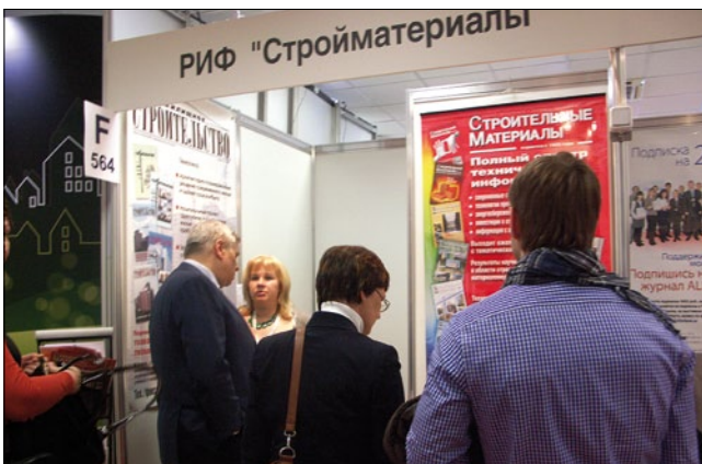
Стенд издательства «СТРОЙМАТЕРИАЛЫ» никогда не пустует