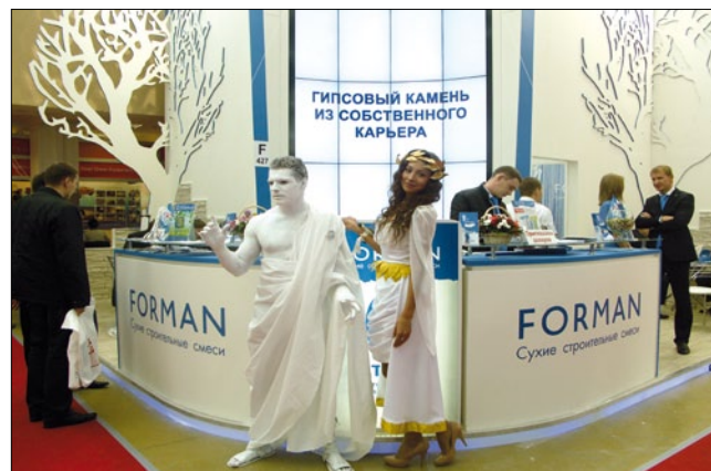
Высокопрочный гипс, производимый на Самарском гипсовом комбинате, используется не только как строительный материал