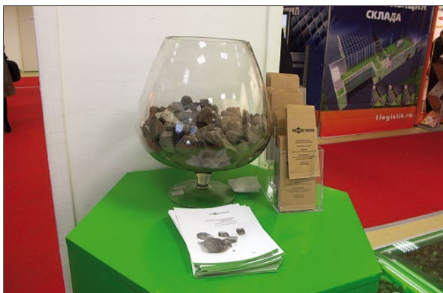
К запуску производства пенностекляного щебня под торговой маркой «Пенностекло» готовится компания «АйСиЭм Гласс Калуга». Образцы продукции представлены на стенде

Главным итогом MosBuild стали подписанные контракты и достигнутые договоренности. Еще до окончания выставки Национальное новостное агентство Малайзии сообщило, что объем продаж представителей этой страны на MosBuild-2013 достиг 17,8 млн евро. В рамках выставки MosBuild-2013 крупные сделки заключались не только между участниками и посетителями, но и между самими участниками выставки.