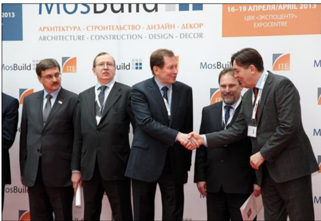
Торжественное открытие MosBuild-2013