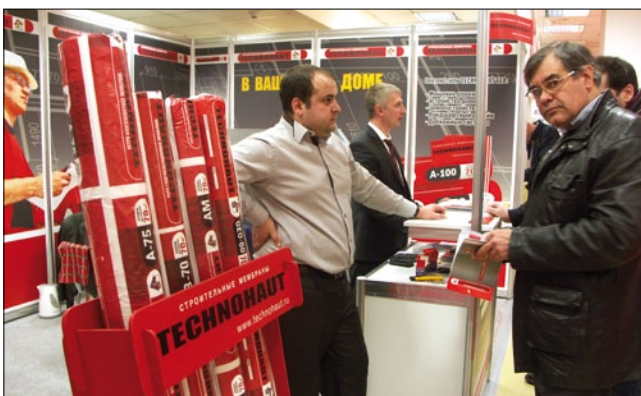
Компания «ТД Шекиноазот» (Тульская область) представила на стенде строительные мембраны марки Технопаут