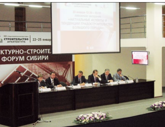
Открытие выставки и Архитектурно-строительного форума Сибири

22–25 января 2013 г. в Красноярске состоялась XXI специализированная выставка «Строительство и архитектура» – один из ведущих выставочных проектов строительной отрасли на территории Сибири и Дальнего Востока. Традиционно выставку организует ВК «Красноярская ярмарка» при поддержке Министерства строительства и архитектуры Красноярского края, Департамента градостроительства Красноярска, НП «Саморегулируемая корпорация строителей Красноярского края», Союза строителей Красноярского края, Инженерно-строительного института СФУ. Площадь экспозиции составила 10,5 тыс. м 2 , на которой разместились 352 компании из 23 регионов России, а также из Швеции, Финляндии, Германии, Болгарии, Турции и других стран.