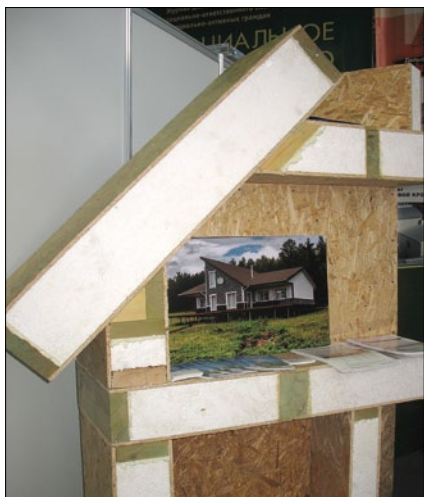
Красноярский завод сэндвич-панелей «ПАНЕЛИКА» начал свою деятельность в 2007 г. Базовым направлением деятельности завода является производство стеновых и кровельных сэндвич-панелей для строительства зданий общественного и промышленного назначений. Панель состоит из двух ориентированных стружечных плит (12 мм) и пенополистирола (150–200 мм). Класс пожарной опасности К3(15).