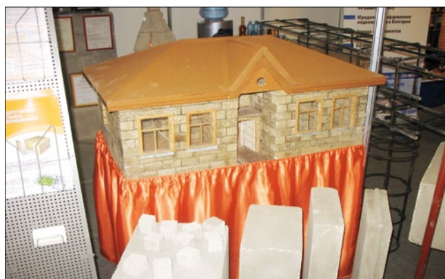
Пример постройки дома из полистиролбетонных блоков представила компания ООО «Завод ЭСТИБ»