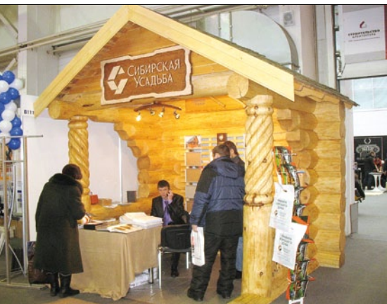
ООО «Сибирская усадьба» представила на выставке образцы своей продукции в виде замысловатых беседок

На выставке был представлен широкий спектр отделочных, теплоизоляционных, конструкционных материалов, технологии производства и монтажа стальных быстровозводимых зданий для промышленных, коммерческих и спортивных объектов, материалы для внутренней отделки помещений, теплые полы, камины и многое другое.