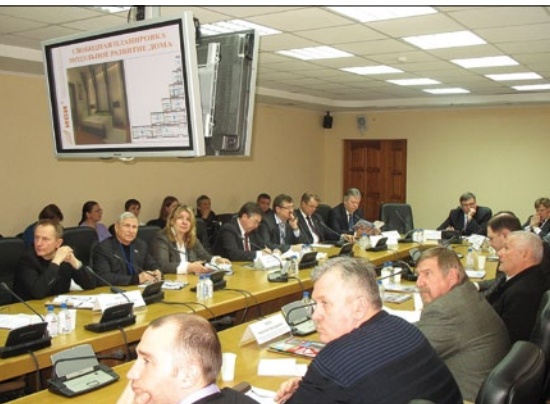
В рамках форума прошел ряд круглых столов по актуальным вопросам в области строительства и архитектуры Красноярского края