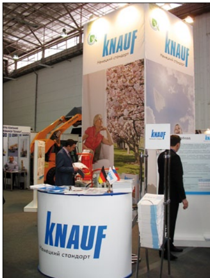
В экспозиции выделялся дизайном и информационной наполненностью стенд немецкой компании «КНАУФ». Ежедневно проводились мастер-классы по использованию различных материалов и комплексных систем