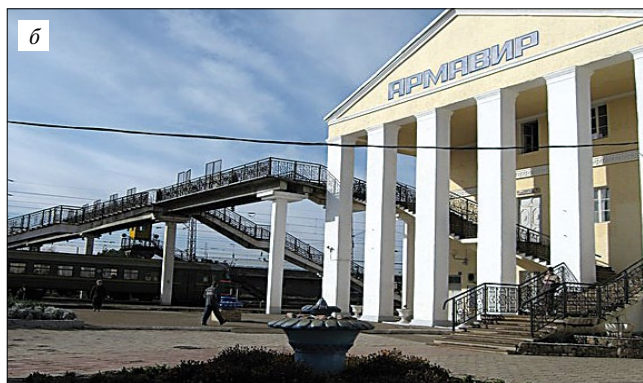
Рис. 4. Армавир. Вокзал Владикавказской железной дороги: а – первоначальный вид; б – современный вид

женность дороги составляла 2511 км. Из основных линий дороги следует отметить следующие: