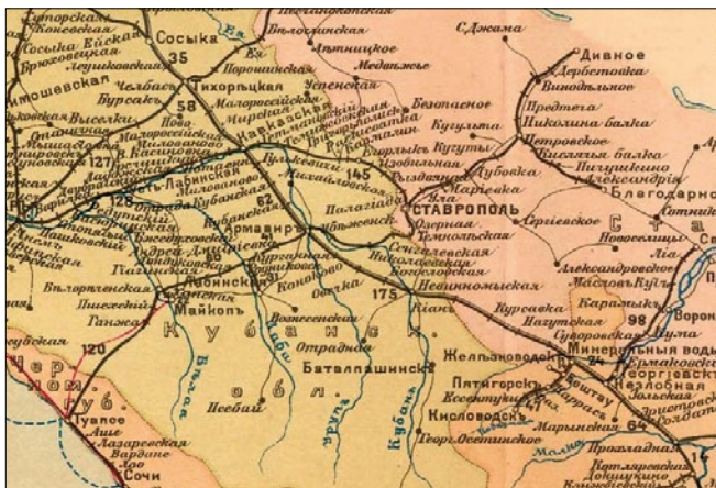
Рис. 1. Фрагмент атласа железных дорог России. 1917 г.

Дорога проходила по многочисленным территориям региона: Кубанской, Терской, Дагестанской областям, области войска Донского, Черноморской, Ставропольской, Астраханской, Саратовской губерниям. На 1913 г. протя-