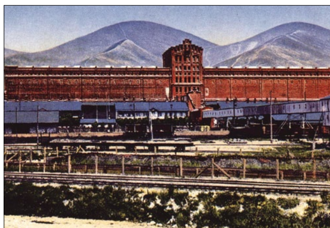
Рис. 2. Новороссийск. Вид на элеватор с южной стороны. 1906 – 1908 гг.