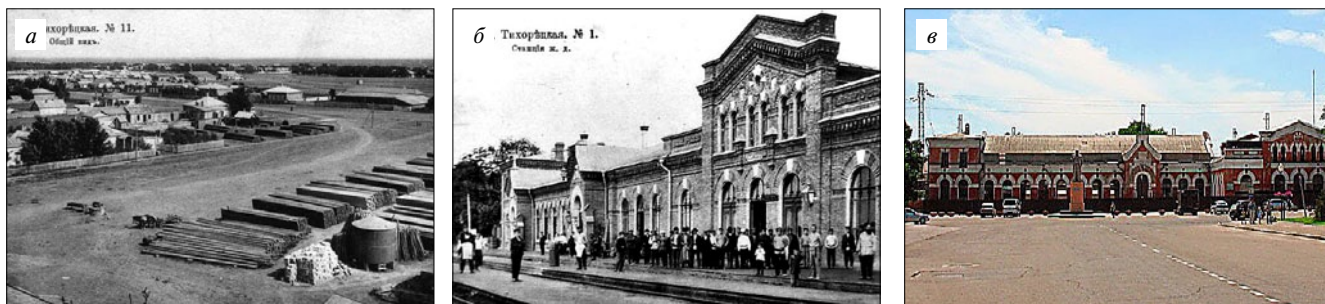
Рис. 5. Станция Тихорецкая: а – первоначальный вид застройки; б – первое здание вокзала; в – современный вид