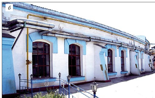
Рис. 7. Локомотивное депо станции Кавказская: а – центральная часть комплекса (южный фасад); б – фрагмент крыла северо-западного фасада

ного двухэтажного корпуса) прямоугольной конфигурации. Плоскости фасадов реконструируемых цехов решены просто. Габариты в плане 800×300 м.