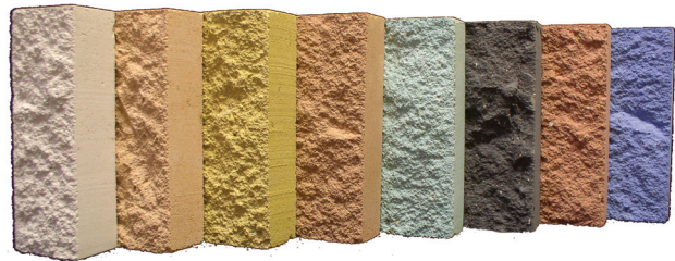
Цветной кирпич со сколотой поверхностью имитирует дикий камень