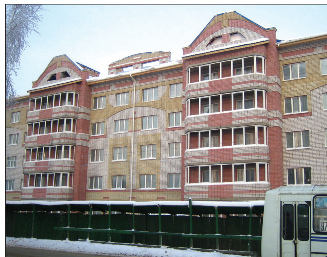
Силикатный кирпич обеспечивает архитектурную выразительность как частных домов, так и многоэтажного жилья