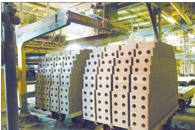
Утолщенный рядовой двухсторонний кирпич

Силикатный кирпич стал внедряться в практику строительства с конца XIX в., после того как в 1880 г. в Германии был получен патент на способ его производства. И уже в начале XX в. в России работало несколько заводов по производству силикатных изделий.