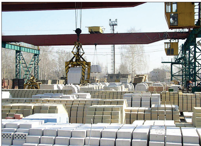
Склад готовой продукции, ассортимент которой отличается значительным разнообразием