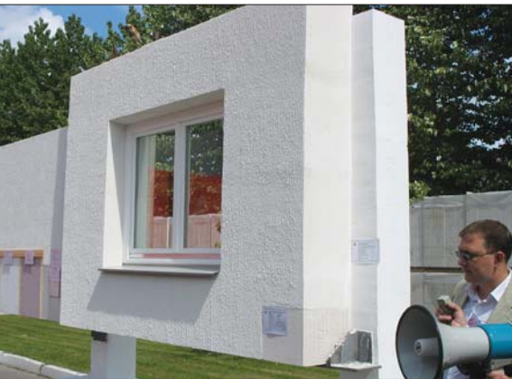
Ячеисто-бетонная панель на комнату