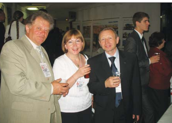
Конференция – редкая возможность встретиться коллегам, которые волей судьбы оказались разделены государственными границами

выми организациями и предложениям клиентам максимальных комплексных услуг. В докладе также были затронуты вопросы перспективности производства и применения собранных на заводе панелей из ячеистого бетона на одну-две комнаты и высотой на этаж (производство таких панелей в разное время осуществлялось в Германии, Польше, Чехословакии, Швеции и России).