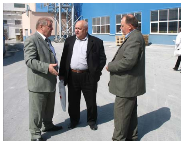
Экскурсии на передовые предприятия отрасли являются важной и самой интересной составляющей конференции