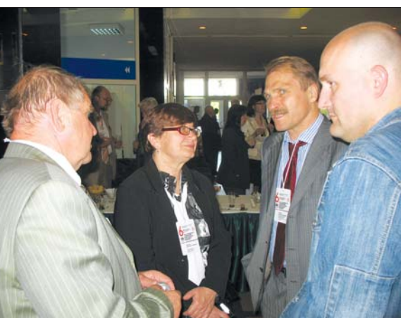
В разговорах коллегам всегда есть что обсудить

состоялась в Минске 26–28 мая 2010 г. Традиционно ее организаторами выступают Министерство архитектуры и строительства Республики Беларусь, Союз строителей Республики Беларусь, институты НИИСМ и БелНИИС, а также наши коллеги из редакций журнала «Архитектура и строительство», «Строительный рынок». В работе конференции приняли участие около 200 специалистов из 12 стран ближнего и дальнего зарубежья (Беларусь, Россия, Украина, Казахстан, Латвия, Литва, Эстония, Германия, Китай, Нидерланды, Польша, Финляндия). Генеральным спонсором и техническим консультантом конференции выступила немецкая фирма «Маза» (Masa-Henke Maschinenfabrik GmbH).