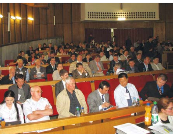
На конференцию приезжают не просто участники, а коллеги, единомышленники, друзья