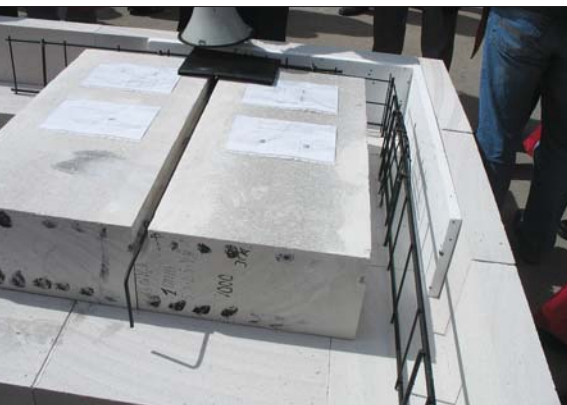
Армированные ячеисто-бетонные плиты перекрытия