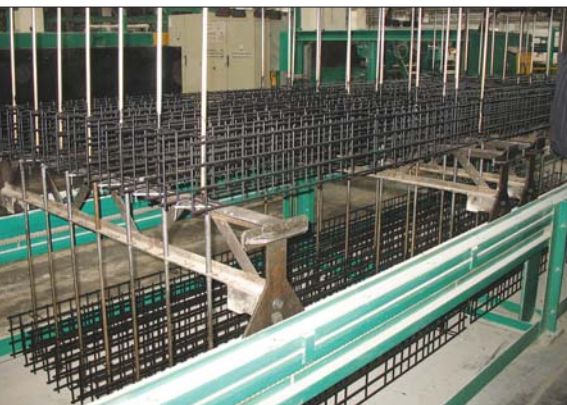
Арматурный каркас готов к установке в форму