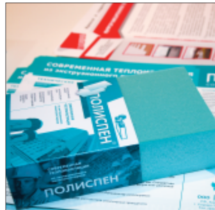
Совсем новый экструдированный пенополистирол Полиспен