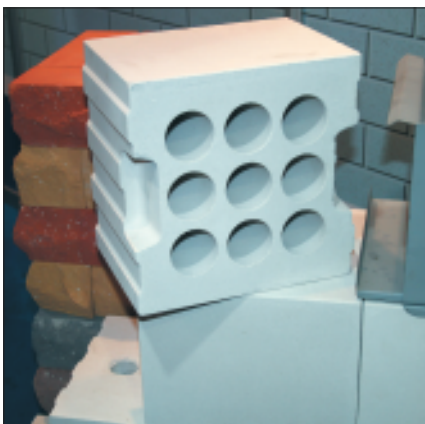
Многopустотные силикатные блоки на стенде ООО «Силикатстрой»