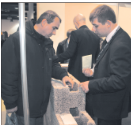
Стены из блоков Durisol можно дополнительно утеплить слоем пенополистирола