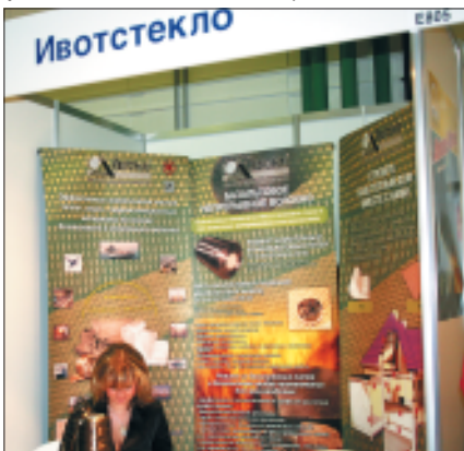
Компания «Ивотстекло» недавно начала производить продукцию