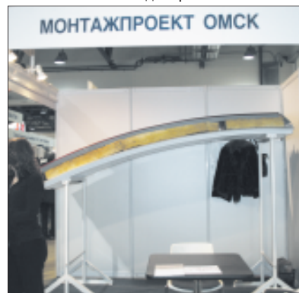
Конструкция арочного профнастила для большепролетных сооружений