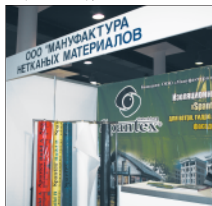
Российский «Спантекс» служит основой для производства многих рулонных материалов