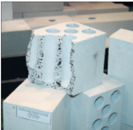
Силикатный кирпич с керамзитовым песком Ярославского завода силикатного кирпича