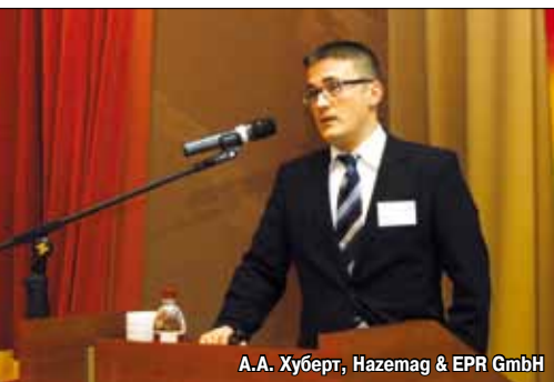
А.А. Хуберт, Hazemag & EPR GmbH