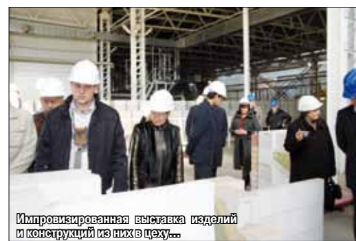
Импровизированная выставка изделий и конструкций из них в цеху...