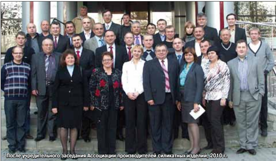
После учредительного заседания Ассоциации производителей силикатных изделий, 2010 г.

ленности, практически перестало существовать, Россию устремились зарубежные производители технологического оборудования. В конференции 2008 г. приняли участие представители машиностроительных фирм из зарубежных стран. Она фактически стала международной. Генеральным спонсором конференции выступила немецкая фирма MASA.