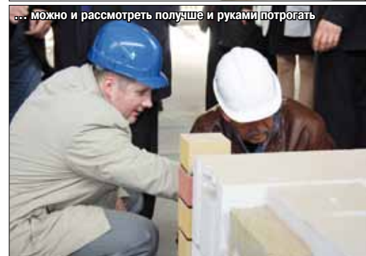
... можно и рассмотреть получше и руками потрогать