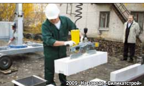
2009. На заводе «Силикатстрой»