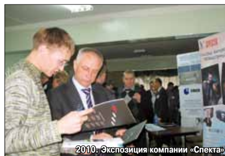
2010. Экспозиция компании «Спектра»