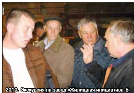
2010. Экскурсия на завод «Жилищная инициатива-5»

Конференция СИЛИКАТЭКС не случайно стала определенной вехой в развитии силикатной промышленности России. Журнал «Строительные материалы»® – организатор конференции с первых лет существования стал проводником технической политики в отрасли, отражая новое в науке и технике, рассказывая о людях, работающих в промышленности и строительной науке. Производству силикатных стеновых материалов в журнале всегда отводилось значительное место. С 30-х гг. прошлого века силикатные стеновые материалы стали основными для возведения стен зданий и сооружений, поэтому и производство силикатного кирпича было одной из главных тем журнала с первых лет его издания.