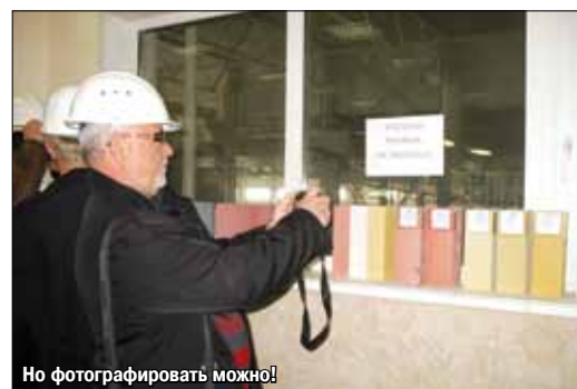
Но фотографировать можно!