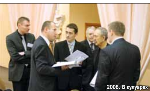
2008. В кулуарах